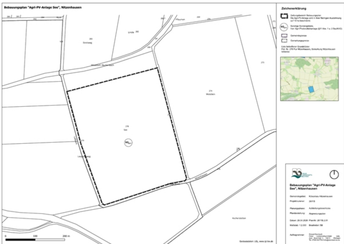
Abgrenzungsplan „Bebauungsplan „Agri-PV-Anlage See“

Das Plangebiet wird derzeit als Acker genutzt. Die angrenzenden Flächen werden ebenfalls ackerbaulich bewirtschaftet. Nördlich des Plangebiets verläuft die Landesstraße L 1034. An der westlichen Grundstücksgrenze befindet sich entlang eines Wirtschaftswegs eine Baumreihe. Südlich des Wirtschaftswegs liegt der Heiligenbach mit begleitenden Gehölzen. Schutzgebiete oder geschützte Biotope sind von der geplanten Anlage nicht betroffen. Zur Beachtung der artenschutzrechtlichen Belange wird eine spezielle artenschutzrechtliche Prüfung erstellt. Dabei soll im Wesentlichen das Vorkommen von Vögeln untersucht werden. Sollten sich allerdings noch andere Artengruppen, wie z.B. Reptilien, als relevant erweisen, werden diese ebenfalls erfasst.