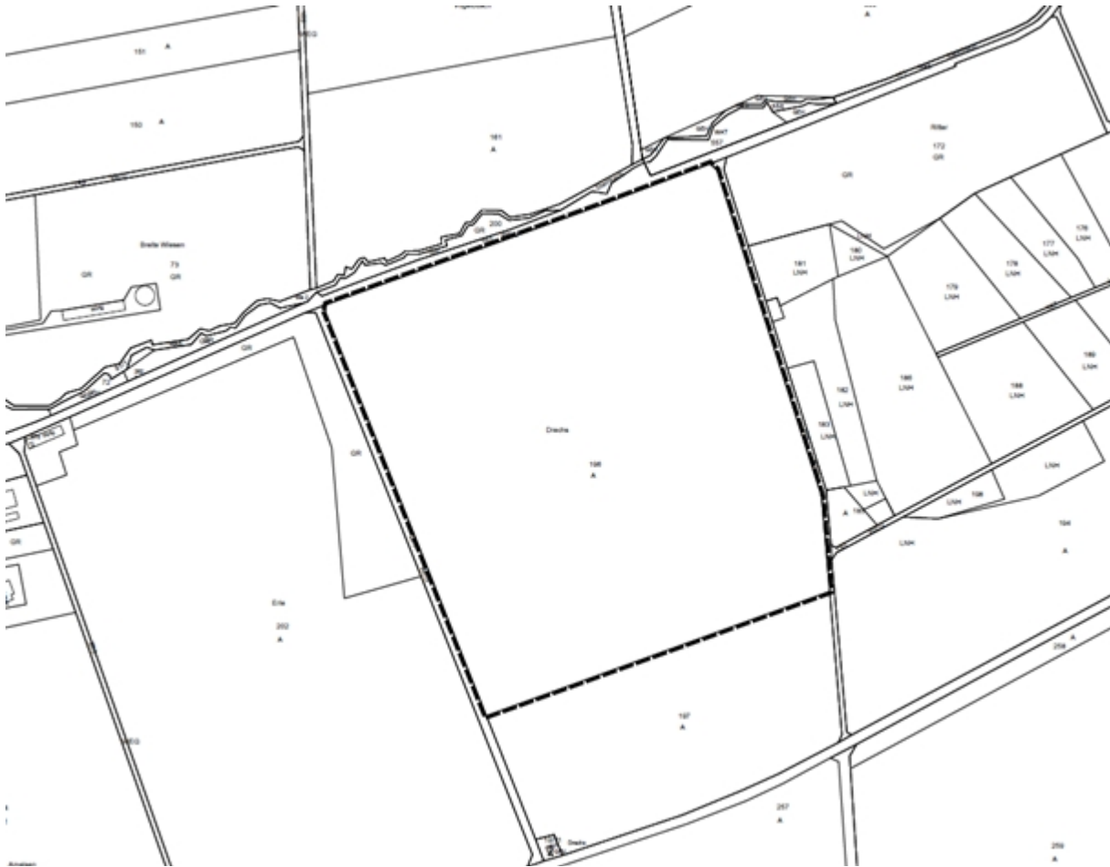
Abb. 1: Ausschnitt Abgrenzungsplan „Agri PV-Anlage KÜN-Steinbach“ vom 28.04.2026

Parallel zum Bebauungsplan erfolgt nach § 2 (4) BauGB eine Umweltprüfung, in der die voraussichtlichen erheblichen Umweltauswirkungen ermittelt werden und in einem Umweltbericht beschrieben und bewertet werden. Gemäß Regionalplan Heilbronn-Franken 2020 liegt das Vorhaben in einem Vorbehaltsgebiet für Landwirtschaft.